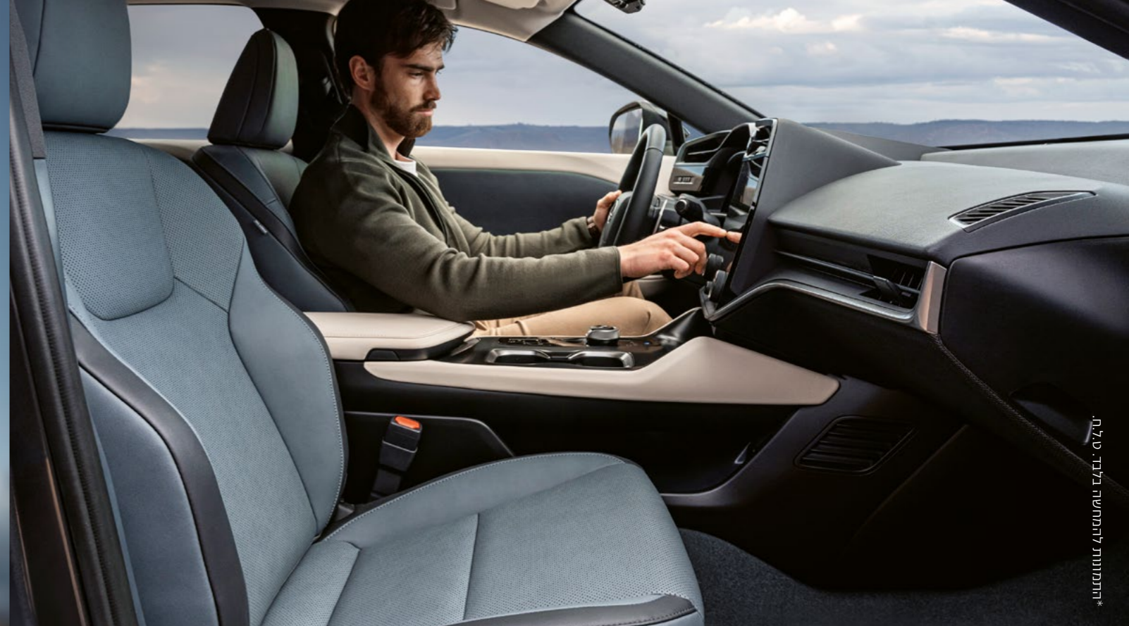
צבעים | צבעי פנים