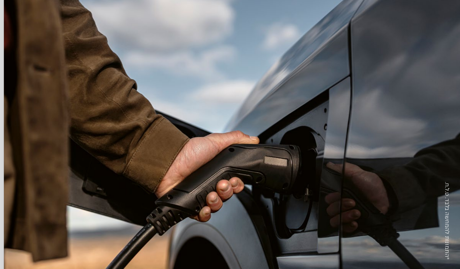
*התמונות להמחשה בלבד. טל.ח.