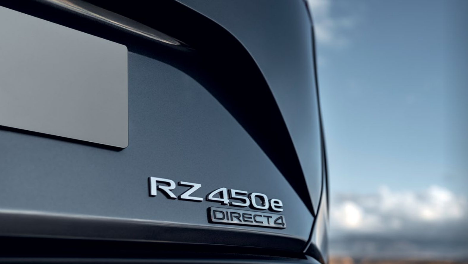
צבעים | צבעי חוץ